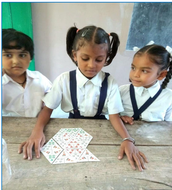
Læringsmaterialer kan bruges på mange måder...

-Husk at TellusArt Academy kan følges på instagram under "tellusartacademy"